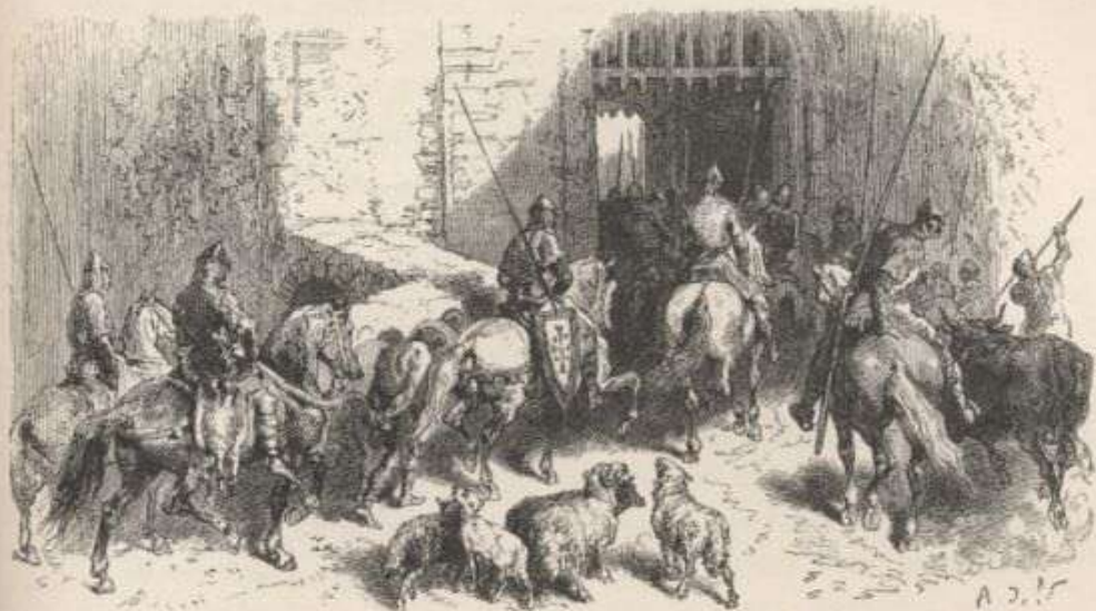
KNIGHTS RETURNING FROM A FORAY WITH SPOILS. — Page 311.