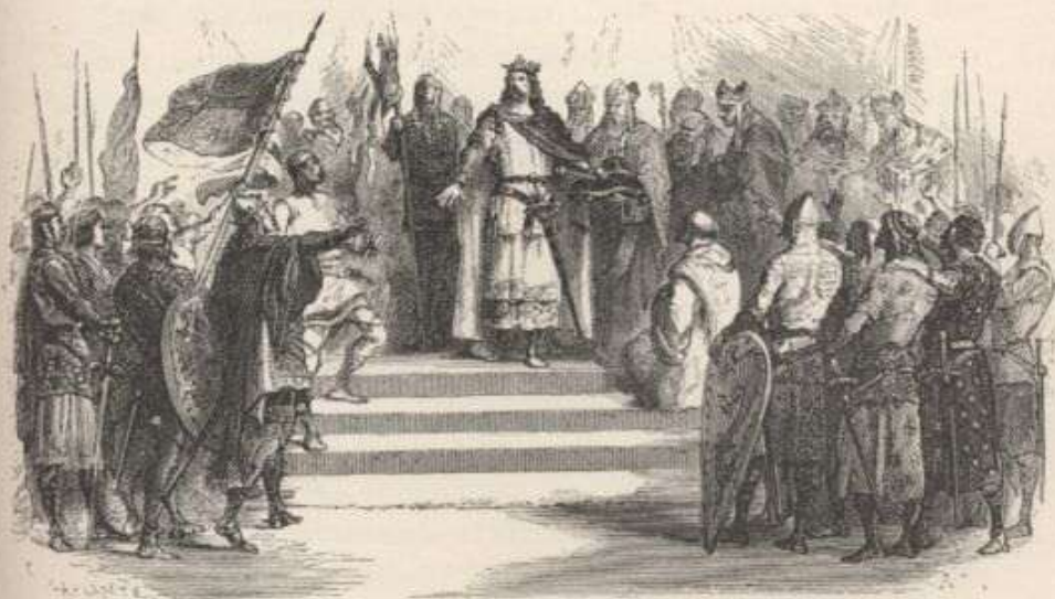
HUGH CAPET ELECTED KING. — Page 300.